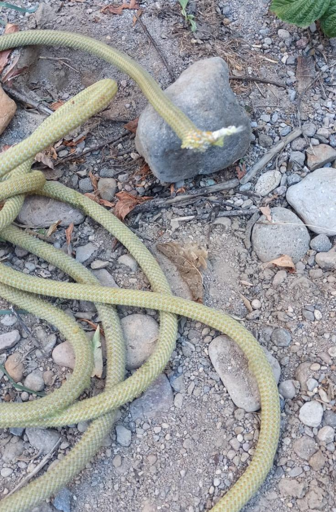
İpte oluşan kesik.