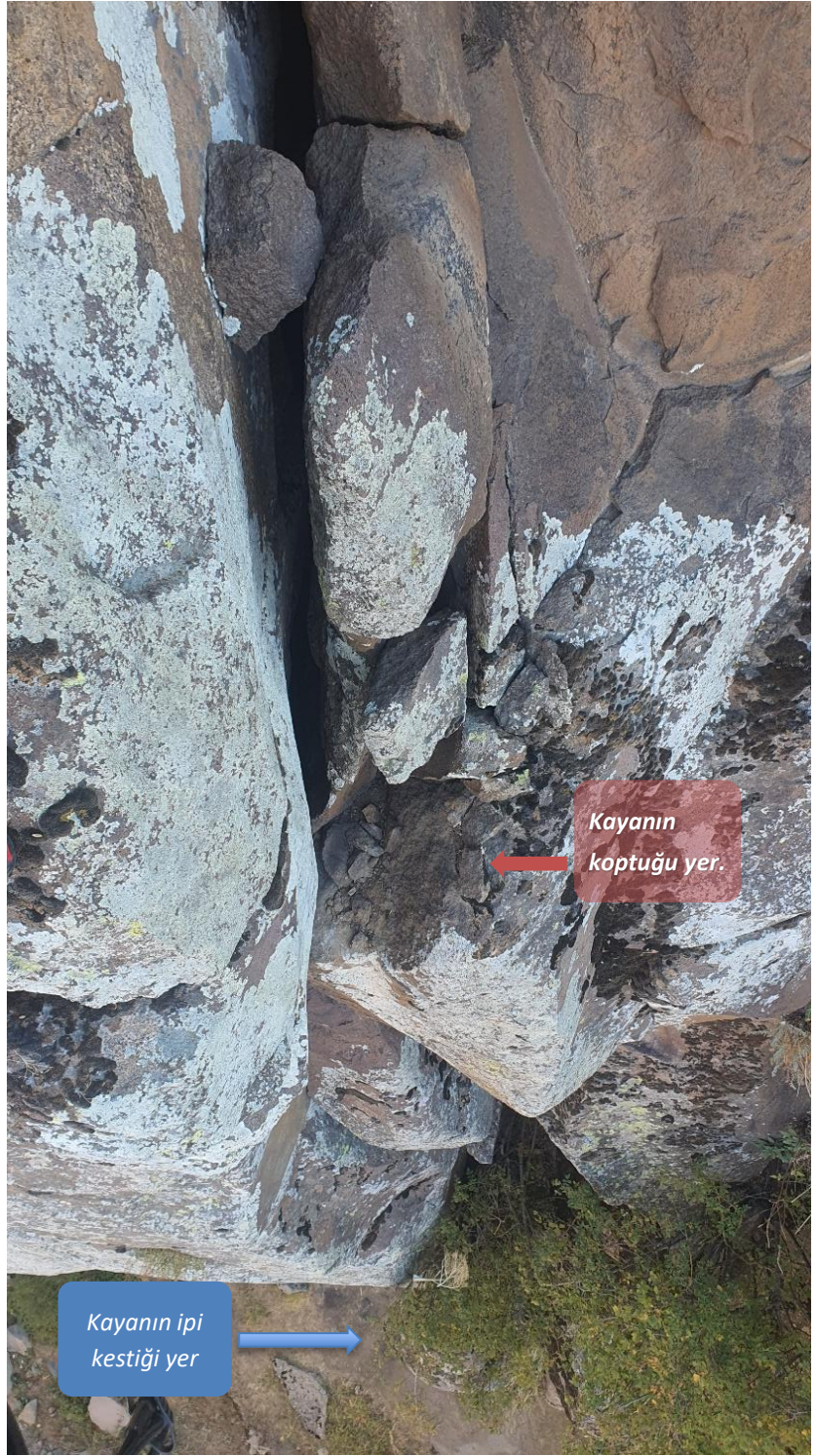
Kayanın koptuğu bölümün üstten çekilmiş fotoğrafı 28/09/2025

İnişe devam edip rotada kalan diğer ara emniyetleri ve expresleri almaya çalıştım 2 ara emniyet içte kaldığı için onları rotada bırakarak aşağıya indim. İniş için oluşturduğumuz istasyonu toplayıp vadiden ayrıldık.